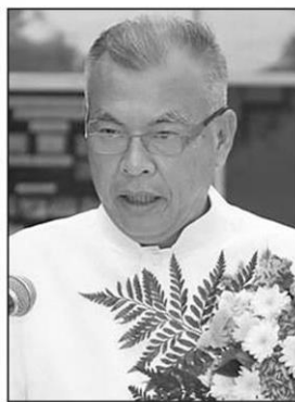
โอกาส ทองยงค์

บัญชี ยากที่จะประสบความสำเร็จ อันจะเป็น การสนับสนุนให้การประกอบอาชีพของเกษตรกร ภายใต้อาณัติการแนะนำส่งเสริมของกระทรวง